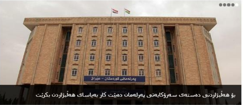
بۆ هەلبژاردنی دەستەیی سەرۆکایەتی پەرلەمان دەیت کار بەیاسای هەلبژاردن بکرت