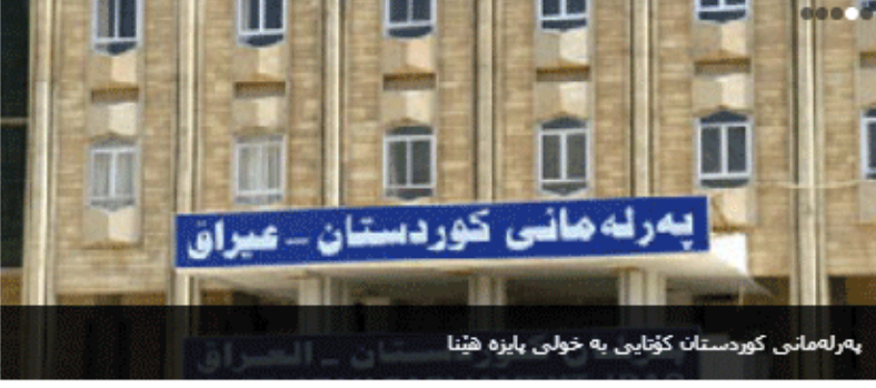
هەوایی پڕۆژەیی پەرلەمان